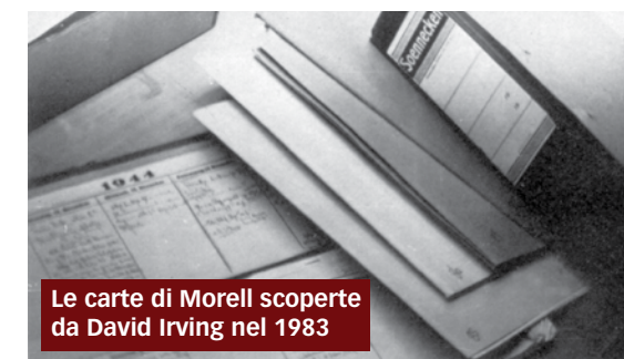
Le carte di Morell scoperte da David Irving nel 1983

Il Pervitin (denominazione chimica: 1-fenil-2-metilaminopropano-idrocloruro) era una sostanza capace di stimolare il sistema neurovegetativo simpatico, ma creava dipendenza. Si scoprì, inoltre, che poteva essere causa di danni gravi e permanenti. Talché, nel 1941, il suo impiego fu sottoposto a limitazioni dalla legislazione tede-