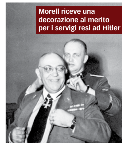
Morell riceve una decorazione al merito per i servizi resi ad Hitler

D'altronde, Morell poteva permettersi di glissare tali importanti domande.