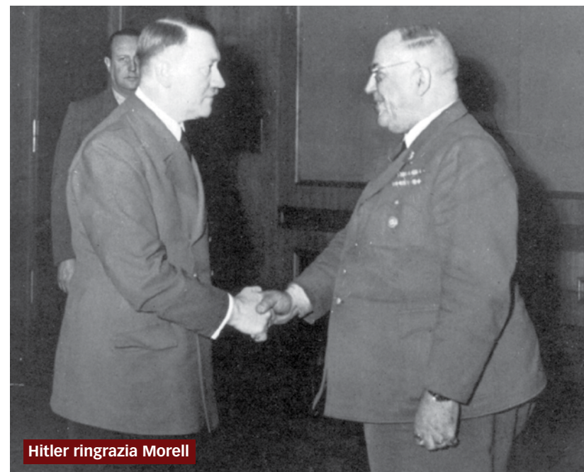
Hitler ringrazia Morell

merito. In lui era sempre presente il timore di una morte precoce. Nell'autunno 1944, ripetutamente affermò che gli restavano solo due o tre anni da vivere. Certamente era convinto che, a quel tempo, non solo sarebbe già stato vincitore ma che avrebbe anche conferito ai tedeschi un potere e un'importanza enormi, tanto da affermare che «gli altri saranno in grado di continuare ciò che io ho lasciato». Altro sintomo significativo della sua nevrosi era la dipendenza da farmaci, quali sonniferi, vari tipi di pastiglie digestive, preparati batterici, pillole «ricostituenti» ed iniezioni. Non che