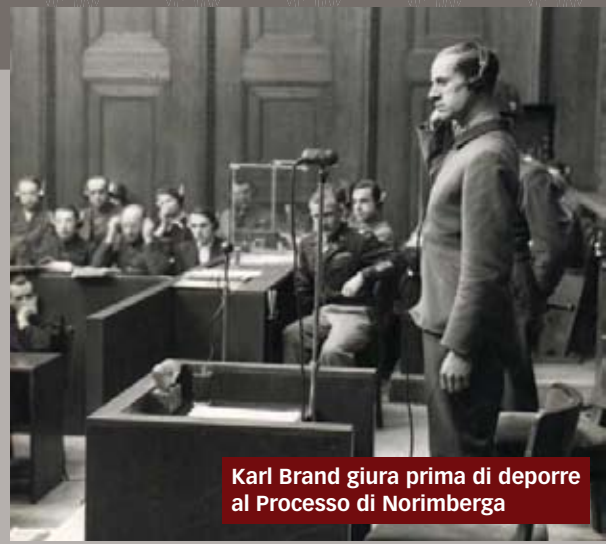
Karl Brandt giura prima di deporre al Processo di Norimberga

K arl Brandt era un giovane chirurgo di bell'aspetto al seguito di Hitler. Fu nominato nell'agosto 1944 Commissario per la Sanità e la Salute del Reich. Fu a capo del «Progetto eutanasia», che avrebbe portato alla morte 70 mila tedeschi giudicati «inadatti alla vita», uccisi con iniezioni letali, camere a gas e in speciali autobus nei quali venivano fatti confluire i gas di scarico; fu anche responsabile degli atroci ed inutili pseudo esperimenti scientifici condotti dai medici nei campi di sterminio; il 16 aprile 1945 fu arrestato a Berlino dalla Gestapo e condannato a morte da un tribunale delle SS ma, dopo la morte di Hitler, fu rilasciato per ordine dell'ammiraglio Dönitz; catturato dagli Alleati il 23 maggio 1945 fu processato insieme con altri medici nazisti operanti nei campi di concentramento e, condannato a morte, fu impiccato a Landsberg il 2 giugno 1948 all'età di 44 anni. (D.I.)