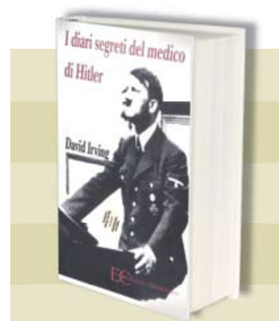
Finalmente tradotto in italiano il saggio di David Irving «I diari segreti del medico di Hitler» sui documenti e le memorie di Theodor Morell (Edizioni Clandestine, pp. 300, € 15,00 - www.edizioniclandestine.com )