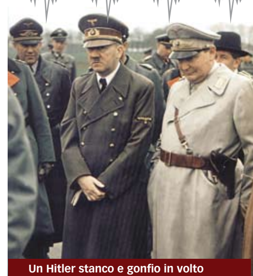
Un Hitler stanco e gonfio in volto accanto ad Hermann Goering. Il dittatore si tiene la mano sinistra, alla quale era affetto da un fremito, probabile indizio di morbo di Parkinson incipiente

sca su narcotici e stupefacenti. Negli incartamenti di Morell questo farmaco compare raramente. Nella sua agenda, in data 15 ottobre 1943, è riportata un'ordinazione di Pervitin per la farmacia Engel, con il poscritto a pena «prodotto esaurito». La farmacia Engel in Berlino riforniva tutti i depositi di medicinali nei quartieri generali del Führer. In data 27 gennaio 1944, tuttavia, è annotato: «Prescrizione di Eupaverina + Pervitin , cuscinetti termici». Morell era consapevole della nocività del Pervitin . Il 1° dicembre 1944 comunicò per iscritto ad un pro-