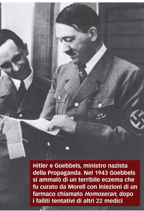
Hitler e Goebbels, ministro nazista della Propaganda. Nel 1943 Goebbels si ammalò di un terribile eczema che fu curato da Morell con iniezioni di un farmaco chiamato Homoseran , dopo i falliti tentativi di altri 22 medici

Ma la somiglianza con il caso di Napoleone è soltanto superficiale. Il condottiero francese odiava i medici e aborrì le medicine fino alla morte. Hitler era, all'opposto, un ipocondriaco. Sin dalla gioventù raramente viaggiava senza la sua scorta di medicinali, poiché credeva di non poter sopravvivere senza pillole, iniezioni e battaglioni di medici al proprio ser-