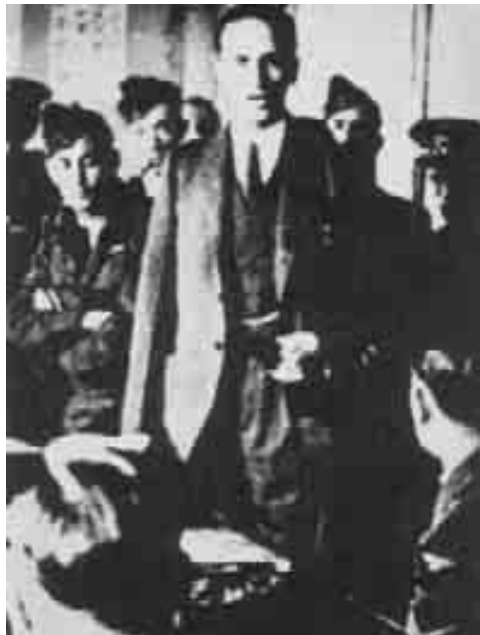
Sir Archibald Sinclair, Luftfahrtminister, im Gespräch mit Flugzeugbesatzungen.