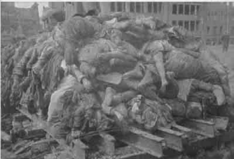
Mit Hilfe von Straßenbahnschienen wurden auf dem Altmarkt behelfsmäßige Scheiterhaufen errichtet, auf denen die Leichen verbrannt wurden.