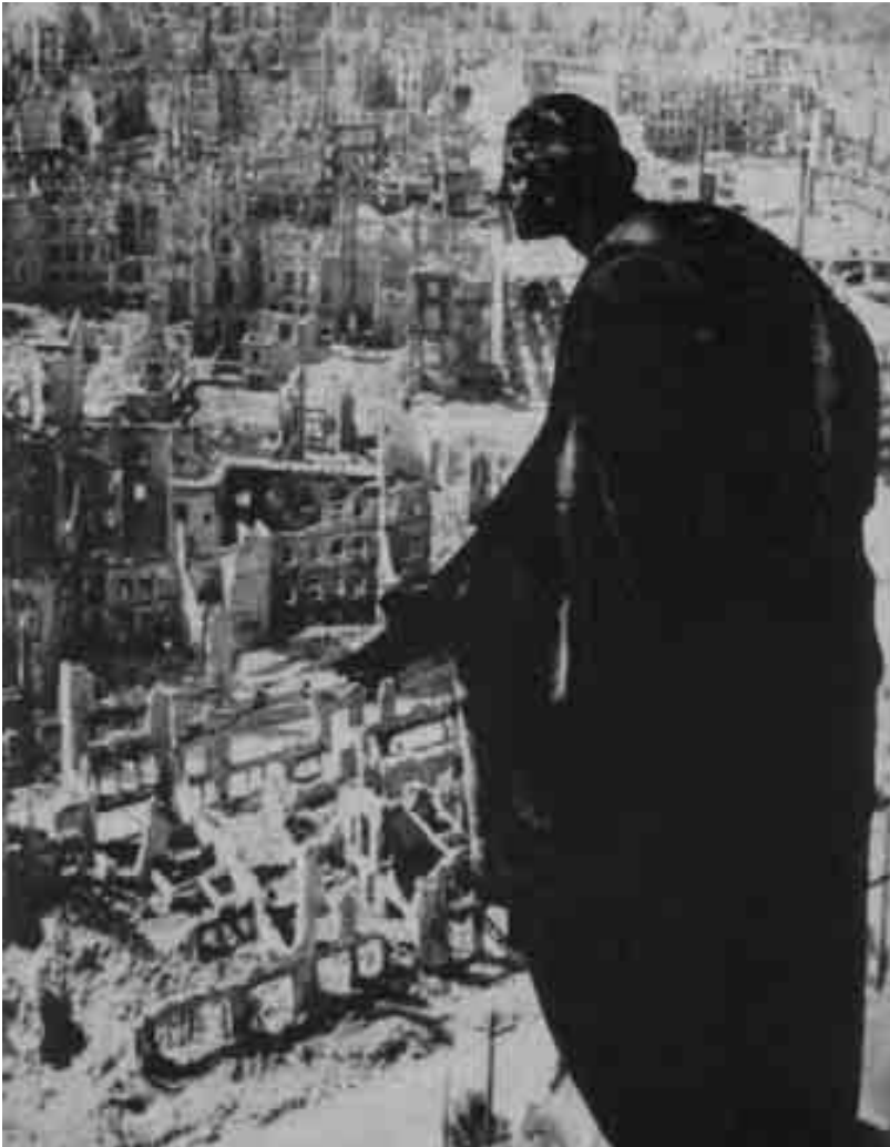
Dresden, Mai 1945.