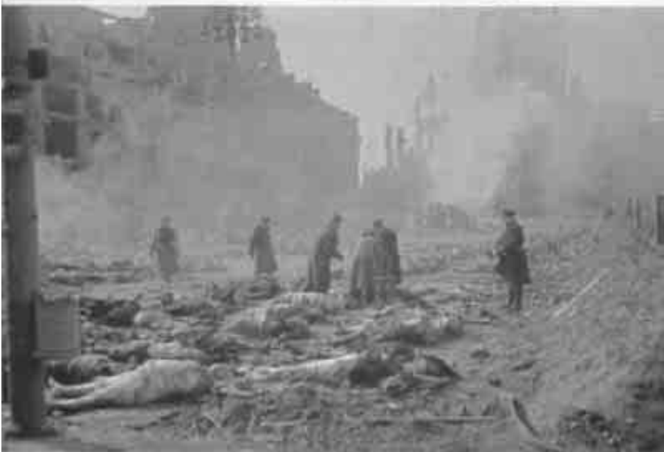
Beim Entstehen dieser Aufnahmen brannten fünf Scheiterhaufen gleichzeitig. Auf dem Platz verstreut sind die Aschehaufen zu erkennen, die zu den Massengräbern abtransportiert werden sollen.