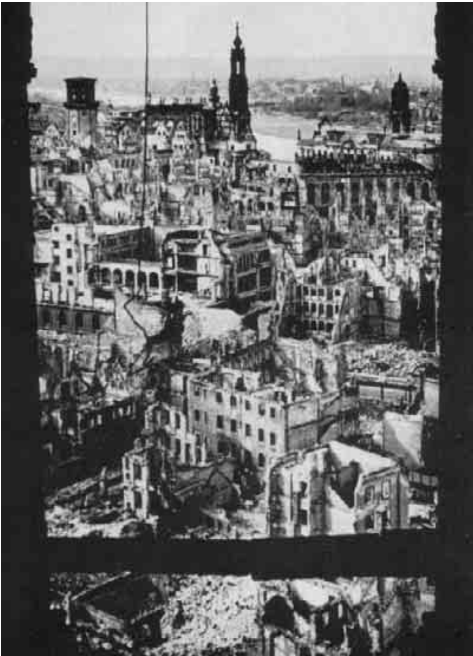
Selbst bis Ende 1945 hatte man kaum damit begonnen, die Trümmer zu beseitigen: Blick auf die Dresdener Innenstadt mit Schloß und Hofkirche.