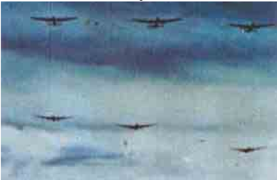
Britische Bomberflotte während des Anflugs.

Noch immer schwiegen die Geschütze, die Dresden verteidigen sollten. Kein einziges Mündungsfeuer war zu sehen. Dem Masterbomber wurde klar, daß Dresden in Wirklichkeit ohne Flakabwehr war. Er konnte die schweren viermotorigen Lancasters ohne Risiko heruntergehen und aus geringer Höhe bombardieren lassen, wodurch ein gleichmäßiger Bombenteppich über dem Angriffssektor erzielt wurde. Er rief die Verbindungs-Lancaster 1, die mit den Bomben in ständiger Morseverbindung stand: »Fordern Sie die Maschinen im oberen Höhenbereich auf, bis unter die mittlere Wolkendecke herunterzugehen.« »Verstanden.« Um 22 Uhr 13 fielen die ersten Bomben auf Dresden. Der Hauptmarkierer machte den Masterbomber auf die charakteristischen dumpfen Explosionen der riesigen Viertausend- und Achttausendpfund-Sprengbomben aufmerksam, die die Fenster eindrücken und die Dächer der leicht brennbaren,