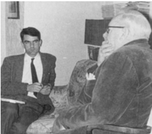
Der Autor interviewt Sir Arthur Harris, 1961 und 1962

Dank für ihre Unterstützung schulde ich Sir Arthur Harris, dem früheren Oberbefehlshaber des Bomberkommandos der Royal Air Force, und Luftmarschall Sir Robert Saundby, der sein glänzendes Gedächtnis bemüht hat, die Ereignisse, die hinter der Durchführung der RAF-Angriffe standen, zu rekonstruieren, und der mit viel Geduld den Text dieses Buches überprüft und kritisch durchgesehen hat.