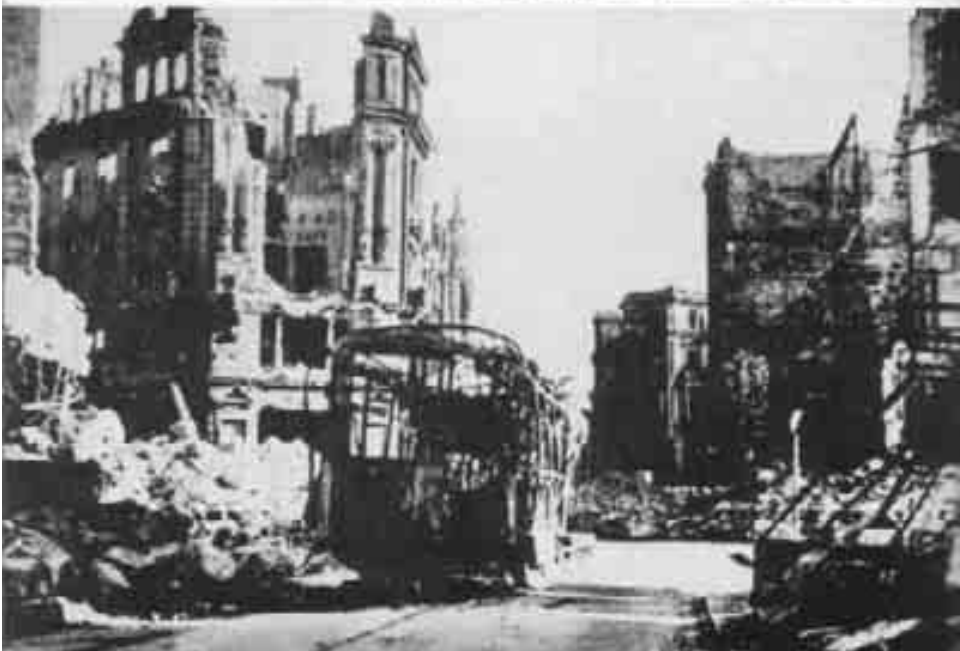
Oben: Dresden – der Rand des Feuersturmgebietes: Pirnaischer Platz mit Ringstraße. Unten: Ein ausgebrannter Straßenbahnwagen in Dresden an der Kreuzung Moritzstraße und König-Johann-Straße.